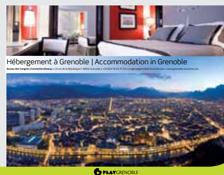
Hébergement à Grenoble | Accommodation in Grenoble

Bureau des Congrès Convention Bureau - 14 rue de la République | 38000 Grenoble - Tél. : +33 (0)4 76 03 37 53